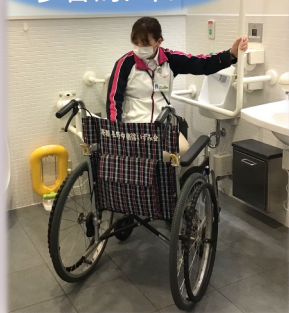
各階に1か所ずつあります。