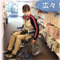
車いすでも歩行者とすれ違うことができます。方向転換も可能。